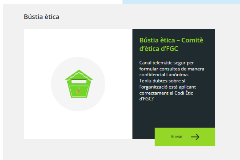
Nova Bústia Ètica d'FGC