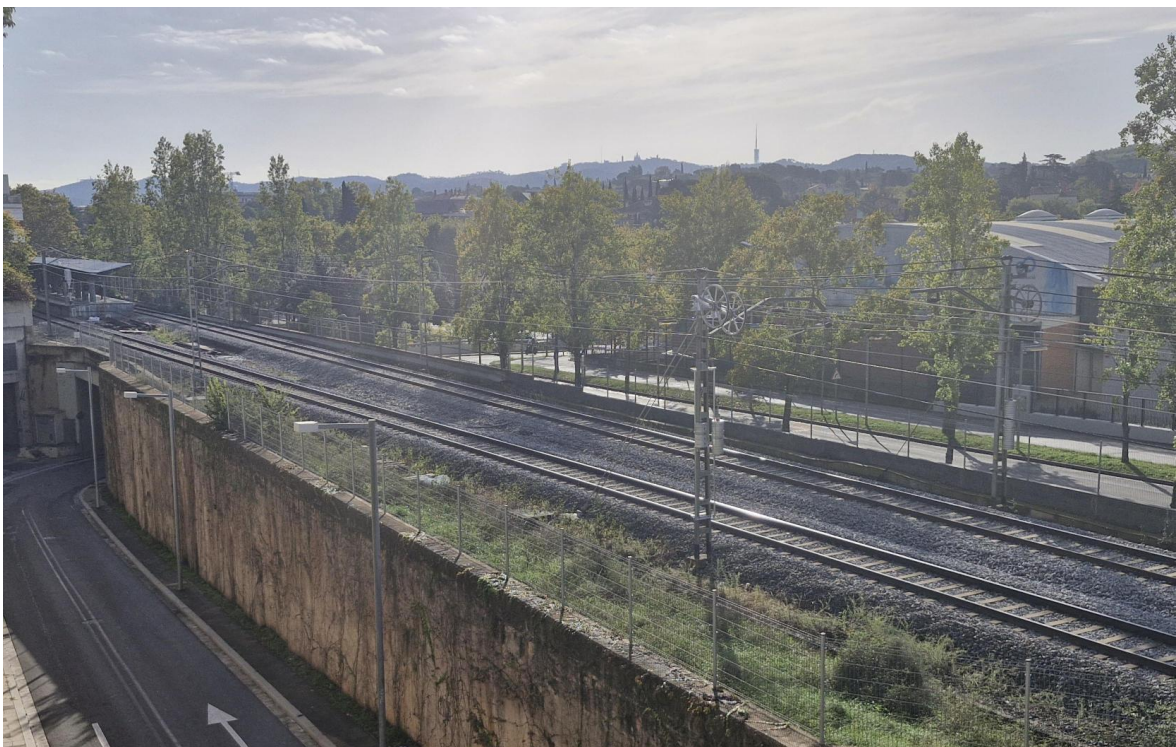
Compensacions dobles instal·lades a l'alçada de l'estació d'FGC de Mira-sol.

Ferrocarrils de la Generalitat de Catalunya (FGC) ha licitat aquest dimecres els treballs per reforçar la robustesa de la catenària i adaptar-la als efectes del canvi climàtic al tram entre La Floresta i Volpelleres, a la línia Barcelona-Vallès; i al tram entre Piera i Masquefa, a la línia Llobregat-Anoia.