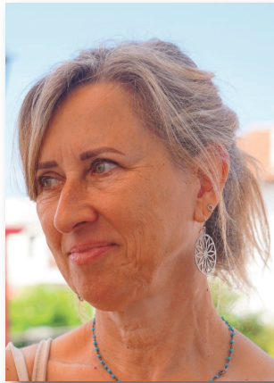
Consellera (Des d'octubre de 2024)

Quatre persones en representació del departament de l'Administració de la Generalitat competent en matèria d'infraestructures i mobilitat, amb rang mínim de director general