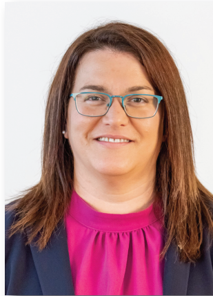
Consellera (Des de març de 2025)

Una persona en representació de l'Associació de Municipis per a la Mobilitat i el Transport Urbà (AMTU)