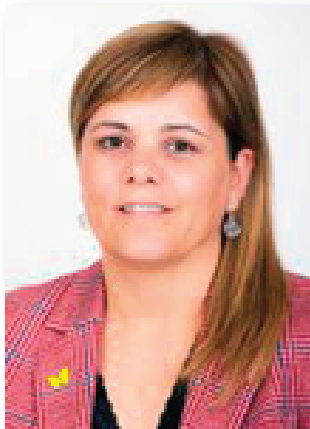
Consellera (Des de març de 2024)

Quatre persones en representació dels municipis als quals FGC presta serveis