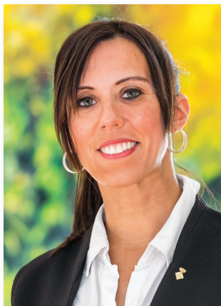
Consellera (Des de setembre de 2020)

Concepció Cañadell Salvia Alcaldeessa de Tèrmens