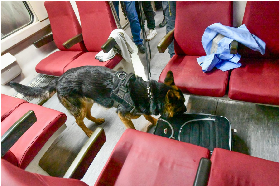
Un gos policia durant una de les proves de detecció a l'interior d'un tren d'FGC.