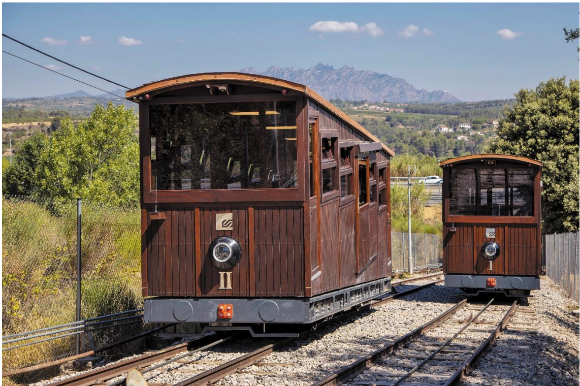
Els cotxes modernitzats del funicular, després de la seva renovació el 2017.

A principis del 1980, la Generalitat va encarregar la gestió del Funicular de Gelida a Ferrocarrils i, durant la tardor de l'any 1981, l'antic Funicular de Gelida va realitzar el seu últim viatge i el servei va ser interromput temporalment per iniciar els treballs de reforma. Els cotxes es van traslladar als tallers d'FGC a Martorell on es van revisar els xassís i es van construir unes noves carrosseries de fusta, seguint l'estil de les originals. A la línia es van renovar elements de la maquinària així com també es va substituir el sistema de politges i el cable de tracció, i es van renovar completament la via i les estacions. La línia va ser reinaugurada el 3 d'abril de 1982.