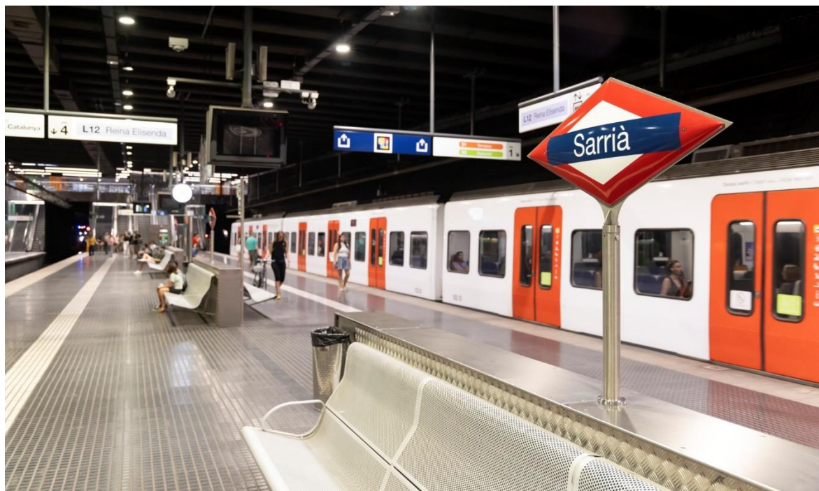
Estació de Sarrià d'FGC

Ferrocarrils de la Generalitat de Catalunya (FGC) oferirà un servei alternatiu d'autobusos del 12 al 20 d'agost entre les estacions de Gràcia i Sarrià, a la línia Barcelona-Vallès, i entre les estacions de L'Hospitalet Av. Carrilet i Gornal, a la