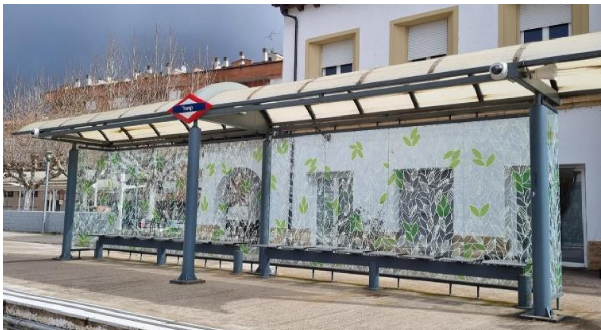
Imatge de la marquesina instal·lada a l'estació de Tremp per evitar el xoc d'ocells.

actuacions que s'han executat destaquen la millora d'un pas per a persones amb mobilitat reduïda a l'estació de Balaguer, a la línia Lleida - La Pobla de Segur; l'increment de la il·luminació a l'entorn de l'estació de Martorell Central, a la línia Llobregat-Anoia; la creació d'un espai de maternitat a l'estació de muntanya de Vall de Núria, i la instal·lació de vinils especials per evitar l'impacte d'ocells a les marquesines de les estacions de Tremp i La Pobla de Segur.